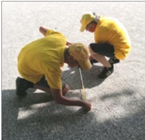
meten is, in dit geval, niet zeker weten