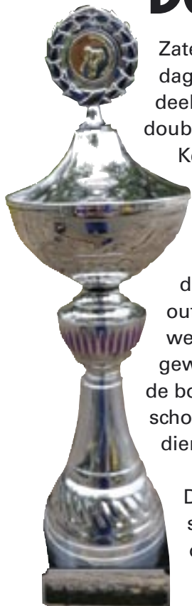
dit is het fel begeerde kleinood

Zaterdag 30 juli, een memorabele dag voor een achttal koppels die deelnamen aan het Vledderse doublettoernooi.