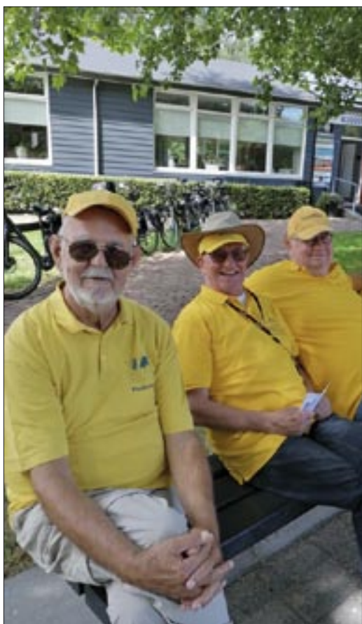
Jammer toch dat een dergelijk evenement altijd van die zonderlinge figuren aantrekt

Om alle partijen van A naar Z te beschouwen vergt teveel van de scribent hij was immers ook bezig met zijn charmante teamgenoot deel te nemen aan het doublet gebeuren